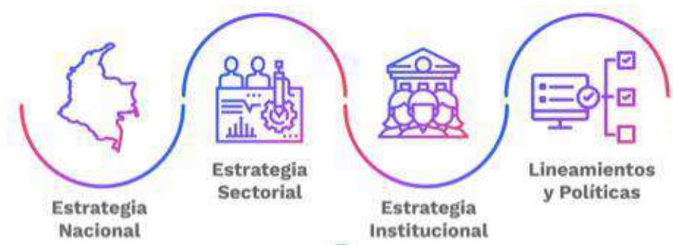
Ilustración 2. Alineación Estratégica

La propuesta del PETI para INDEPORTES, estará alineado a las estrategias nacionales, sectoriales, institucionales y a los lineamientos y políticas que regulan el sector TI.