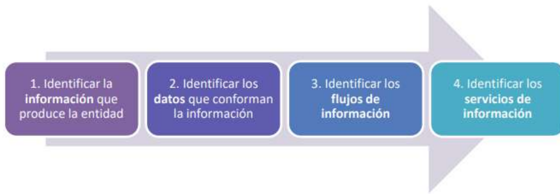
Actividades para construir el catálogo de componentes de información

Ahora bien, para estructurar el catálogo de componentes de la información, se tendrá en cuenta la Guía Técnica de Arquitectura Empresarial, que nos brinda el siguiente lineamiento: